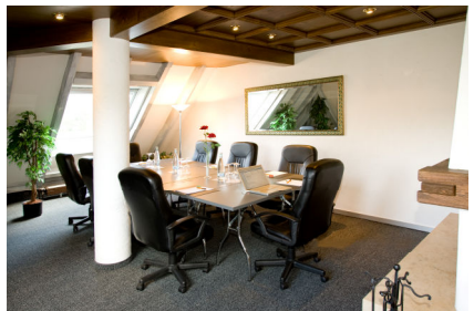
Konferenzraum bis 8 Seminarteilnehmer