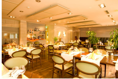
à la Carte-Restaurant