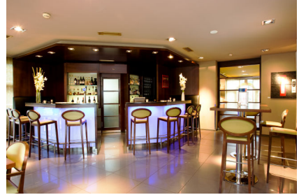
Lounge-Bar, offen bis 01.00 Uhr