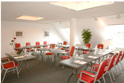
Reppischsaal bis 14 Seminarteilnehmer