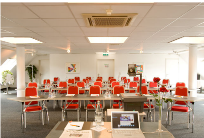
Limmatsaal bis 70 Seminarteilnehmer